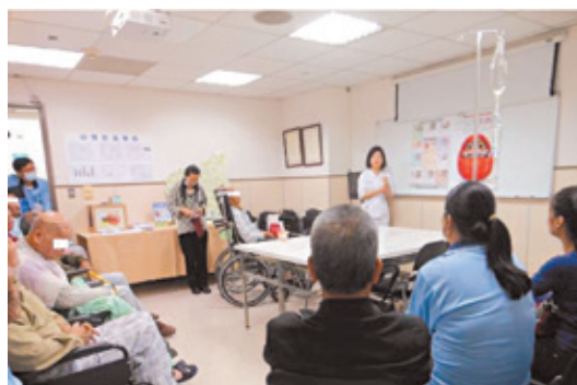
10C病房舉辦「預防跌倒」團體衛教