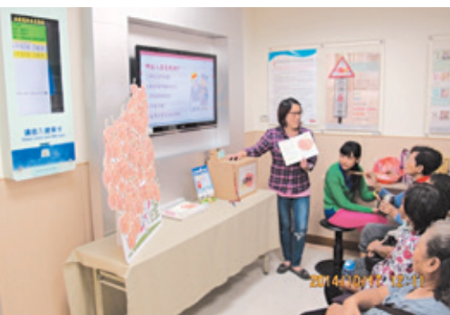
血液透析室的熱烈響應及衛教活動

預防病人跌倒必須要全體總動員，不能只靠醫護人員的努力，尤其病人在住院期間會有很多需要家屬幫忙的地方，一定要有人陪伴。意外事故常常發生在一瞬間，多一份注意與預防，就能少一份傷害與自責。☺