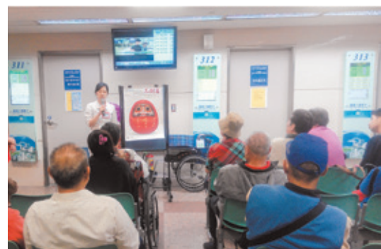
在門診區舉辦「預防跌倒」衛教課程