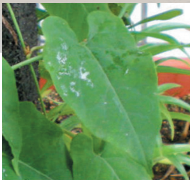
何首烏葉為卵形，先端漸尖。

何能嗣將此藥當做傳家寶，後來也讓兒子服用，父子都活了一百多歲，而且直到百歲，頭髮依舊烏黑。這就是何首烏名