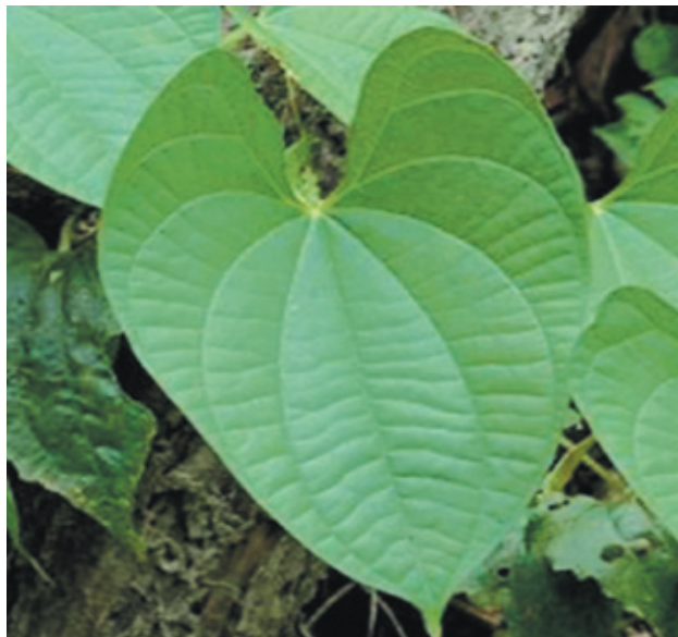
黃藥子為多年生纏繞草本植物