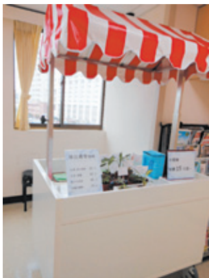
「啡比尋常」可愛的小餐車

「啡比尋常」是向日葵日間病房工作人員為協助會員復健所開設的迷你咖啡店。學姊說，「啡比尋常」剛成立時，會員什麼都不會，不知道如何製作咖啡、如何接待客人，當然也不知道如何將咖啡送到客人的手上。但是透過日間病房工作人員一個步驟、