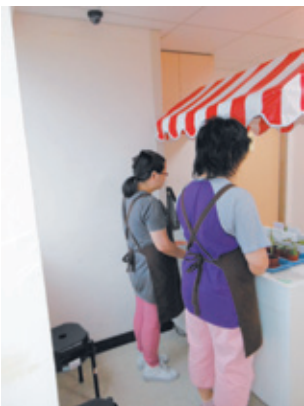
滿心期待地等待客人光臨