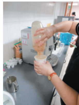
好喝的冰咖啡，想嚐嚐看嗎？