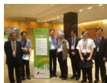
台灣與會學者合影3