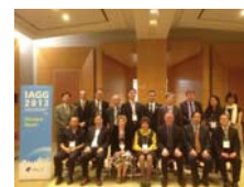
亞太地區會議(IAGG Asia-Oceania Regional Meeting)各國代表合影