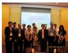
台灣與會學者合影2