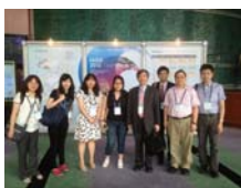
台灣與會學者合影1