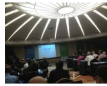
國際老年醫學學會的委員會 議