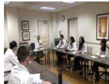
和UCSD藥學實習生一起上課