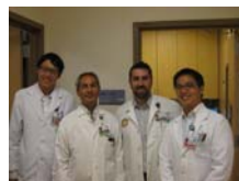
和主要指導我們的臨床藥師合照