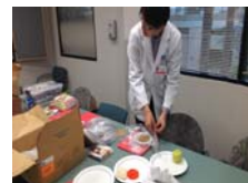
俊昌準備病患衛教