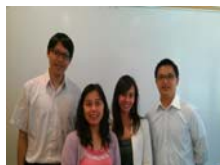
5.23.13 UCSD visit