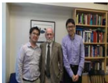
和藥學院院長合照