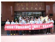
中國醫藥大學國際志工醫療服務隊熱情啟程。