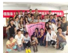
赴南投縣仁愛鄉眉溪部落實施衛教操練。