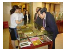
李同豐國醫館收藏豐富。