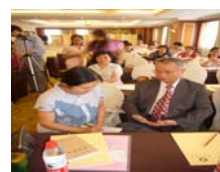
林昭庚大師接受媒體記者採訪。