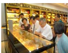
李同豐國醫館珍藏引人興趣。