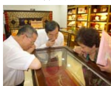
中醫藥的珍品仔細瞧！