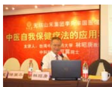
中醫針灸大師林昭庚教授開講。