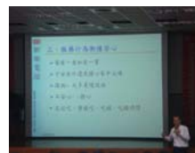
健康服藥足安心講座