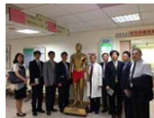
參觀針灸科- 張永賢教授與韓方學者在針灸科門診合影