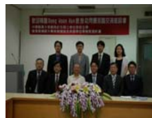
中韓與會學者合影