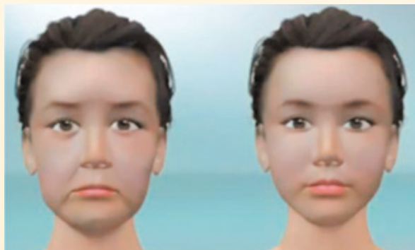
針灸美容有拉提臉部的效果

中醫醫美的方式有很多種，可分為中藥、食膳、針灸、推拿按摩、氣功、養生，以及中藥面膜和中藥藥浴等。以臉部美容為例，中醫的治療範圍包括面部痤瘡、皺紋和皮膚鬆弛、眼袋、黑斑、黃褐斑等。目前比較常用的如「針灸美容法」，是以針刺、灸療的方式刺激經絡穴位，調理各臟腑組織的功能以促進氣血運行、疏通經絡以抵禦外邪入侵，達到延緩衰老、美化容顏的目的。