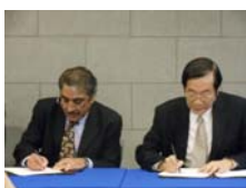
兩校校長進行簽約