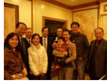
與年輕一代的藥學系校友合影(34屆、36屆及42屆 藥學系)