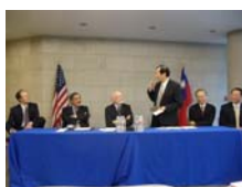
校長於簽約前致辭