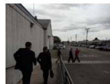
參觀融合二次世界大戰留存的軍醫院及現代建築的Harbor-UCLA medical center