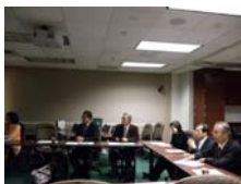
與南加州大學(USC)醫學科學校區藥學院法規科學國際中心(International Center for Regulatory Science[ICRS])人員進行座談