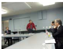
觀Harbor-UCLA medical center的Los Angeles Biomedical Research Institute