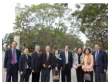
於南加大校園合影