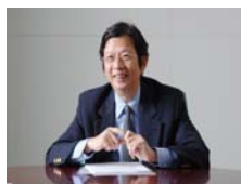
陳偉德教授發表『肥胖兒童及青少年之篩檢與四階段積極減重計畫』。