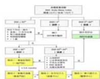
兒童及青少年肥胖之篩檢及處置流程圖。