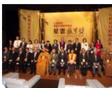
星雲大師、吳敦義副總統、教育部長蔣偉寧與榮獲第一屆星雲教育獎得獎人合影。