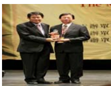
教育部長蔣偉寧頒獎表揚榮獲『星雲教育獎』陳偉德副校長。