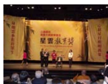
教育部長蔣偉寧頒獎表揚陳偉德副校長。