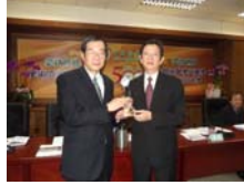
榮獲黃榮村校長在行政會議 公開表揚。