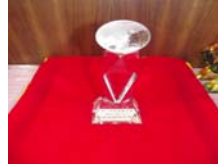
教育界崇高的榮譽~星雲獎 杯。