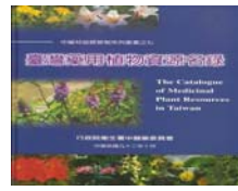
臺灣藥用植物資源名錄。