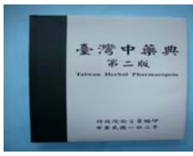
《台灣中藥典》編修問世了。