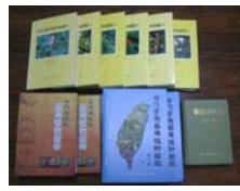
臺灣常用藥用植物圖鑑。