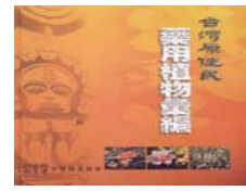
台灣原住民藥用植物彙編。