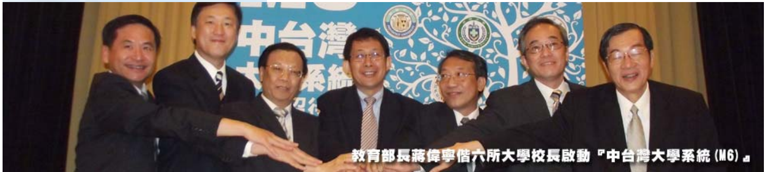
教育部長蔣偉寧偕六所大學校長啟動「中台灣大學系統 (M6)」