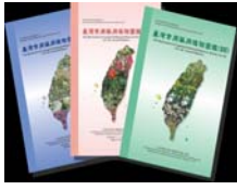
台灣常用藥用植物圖鑑。

資料來源： http://www.cmu.edu.tw/news_detail.php?id=2392