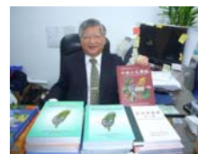
張永勳教授著作豐富。