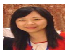
校級教學優良暨教學創新教