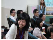
得知獲獎興奮榮譽的一刻