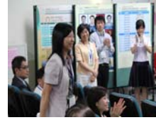
得知獲獎興奮榮譽的一刻