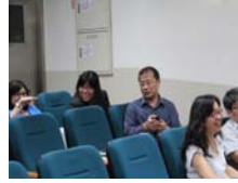
得知獲獎興奮榮譽的一刻