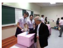
投票時間：遴選委員進行投票