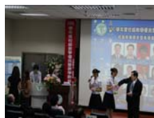
由黃校長抽籤決定候選老師演講順序