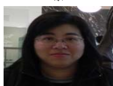
校級教學優良暨教學創新教