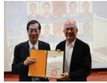
黃校長致贈感謝狀予校外委員：高等教育評鑑中心 鄭瑞城 董事長