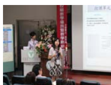
候選教師依序報告教學心得