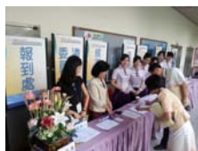
美麗與智慧兼具的紫薔薇親善大使擔任本次遴選會接待工作