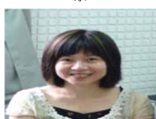
校級教學優良暨教學創新教