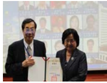
黃校長致贈感謝狀予校外委員：台灣大學生命科學院 羅竹芳 教授