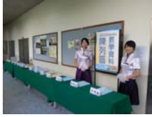
教學書面資料陳列區