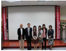
黃校長與3位校級教學優良暨教學創新教師當選人合影留念