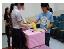
投票時間：班代排隊進行投票