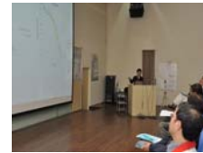
口頭論文發表時間