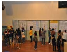
壁報論文展示時間