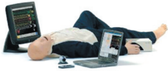
多功能高階模擬人訓練系統