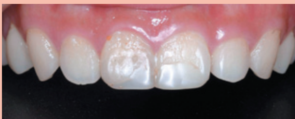
B1. 正中門牙有大範圍的樹脂填補物