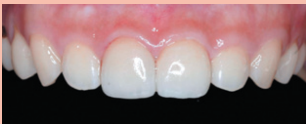
B2. 使用陶瓷貼片改變顏色