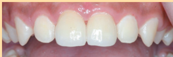
C3. 以陶瓷貼片調整形狀