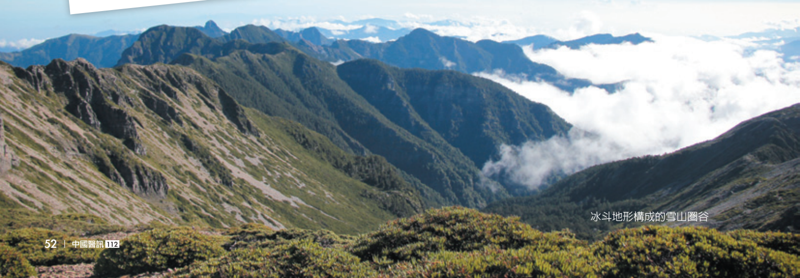
冰斗地形構成的雪山圈谷