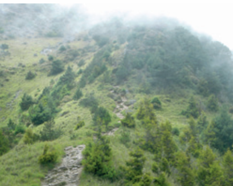
一路陡上，令人看了想哭的哭坡。