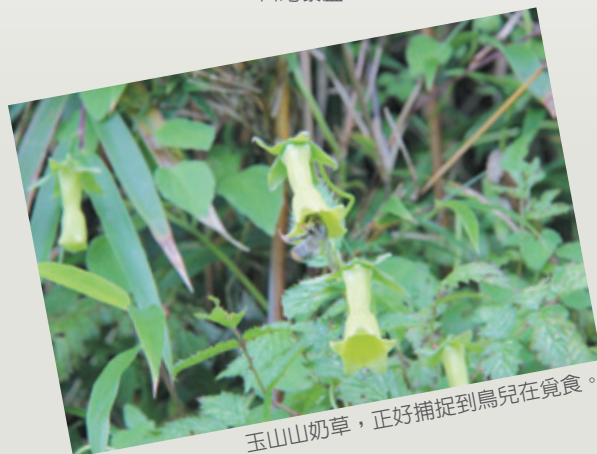
玉山山奶草，正好捕捉到鳥兒在覓食。