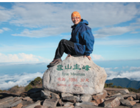
雪山主峰搞怪系列之坐著照