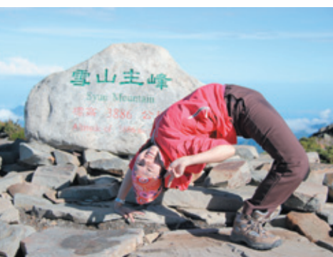
雪山主峰搞怪系列之下腰照