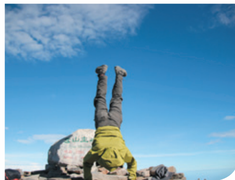
雪山主峰搞怪系列之倒著照