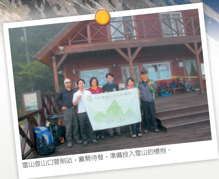
雪山登山口管制站，蓄勢待發，準備投入雪山的懷抱。

台灣地處歐亞板塊、菲律賓板塊與南海板塊之上，長期的板塊擠壓活動造就了島上的五大山脈和兩百多座3000公尺以上的高山，山地與丘陵的總合占全台面積的7成，自古就是登山客的天堂，以及各國登山隊、地質學家、動植物學家、攝影師爭相朝聖的寶島。在1970年間，台灣山嶽協會為了推展登山活動，更選定100座3000公尺以上的高山合稱「百岳」，其中中央山脈有69座，雪山山脈有19座，玉山山脈有12座，攀登百岳自此成為台灣喜愛登山者的重要目標之一。