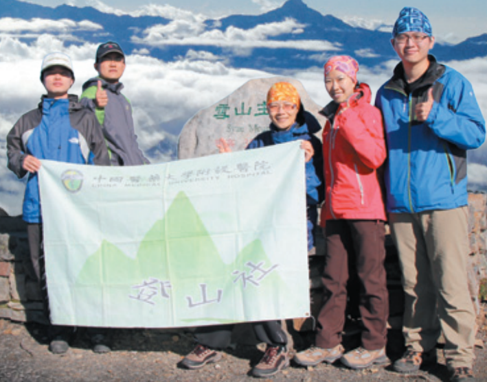
▲雪山主峰旁壯麗的山巒及狀似飛碟的彩雲 雪山主峰合影，為了這張，一切都值得了！▶

由於隔天要夜登雪山主峰，山友們大約7點就安頓就寢，不一會兒，山莊中鼾聲四起，此起彼落，與莊外的蟲鳴和流水聲搭配成夜間交響曲。但這可苦了我，由於不習慣沒有枕頭墊高，再加上這些不協調的魔音穿腦，讓我終於體會到臨床病人所說的不易入睡、淺眠易醒與多夢的感受，看來以後除了用藥物調理病人身體的內在環境，外在環境也要幫忙注意才行。