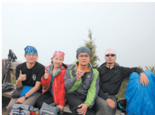
哭坡前觀景台合影。來，1、2、3，哭！