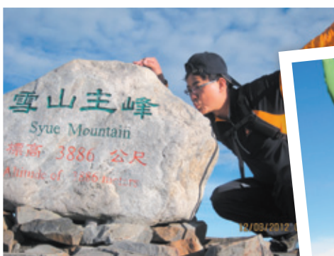
雪山主峰搞怪系列之親著照