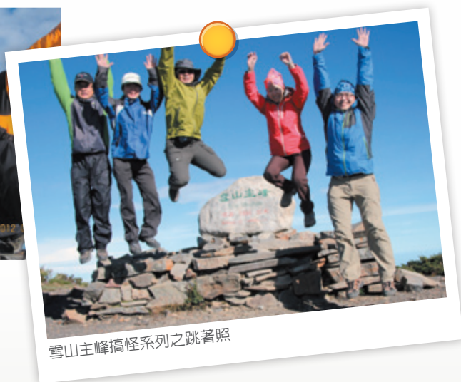
雪山主峰搞怪系列之跳著照

就在輾轉難眠之際，轉眼間，已到了凌晨3點，該起來準備夜登主峰了。輕手輕腳的整理好裝備，吃了士官長準備的早點，我們頂著頭燈繼續前進，由於夜間視線不明，大伙都耐著性子，靜靜穿梭在漆黑的樹林中。這片樹林是全台海拔最高的冷杉純林，俗稱黑森林，全長大約2公里，擁有豐富的生態環境，只是夜間我不敢用頭燈到處亂照，怕會驚動林間夜行的生物。沒多久，天際便開始出現微光，當走出黑森林，已經不需要頭燈了，前方的山巒被陽光照射得像是一面金黃色的銅鏡，燦爛奪目。