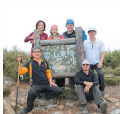
雪山東峰合影，爛爛寫在我們臉上！