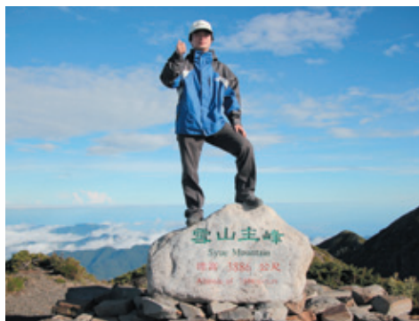
雪山主峰搞怪系列之站著照