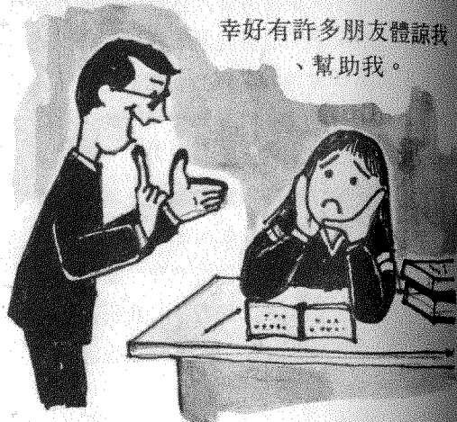
幸好有許多朋友體諒我、幫助我。

只有搖頭苦笑的份，我發現自己的實力很差，由於國文程度低，因此國父思想、中國通史等科目唸起來挺吃力；英文也帶給我很大的苦惱；上課時，對於進度太快的學科只得舉雙手投降。在這種情況下，幸好有許多朋友體諒我、幫助我，這是使我感到溫暖且安慰的事。我希望能在本校順利畢業，更希望在畢業前能提高我的國文程度。