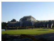
英國倫敦皇家植物園 (Royal Botanic Gardens, Kew)