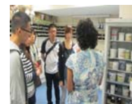
西草藥師介紹西草藥栓劑和藥膏