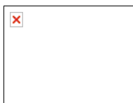
與美威行總經理與專家合影