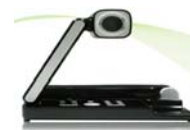
實物提示機：可以用來做： 1.教學備課2.拍攝教學演示 影片3.劃記解說 4.課文導讀 5.習作觀摩 6.即時評量7.投 票互評