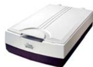
A3 掃描器Microtek XT6060