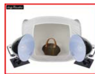
小型攝影棚：讓您輕輕鬆鬆 拍攝教具與展示品