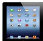
平板電腦The New iPad Wi-Fi 32GB