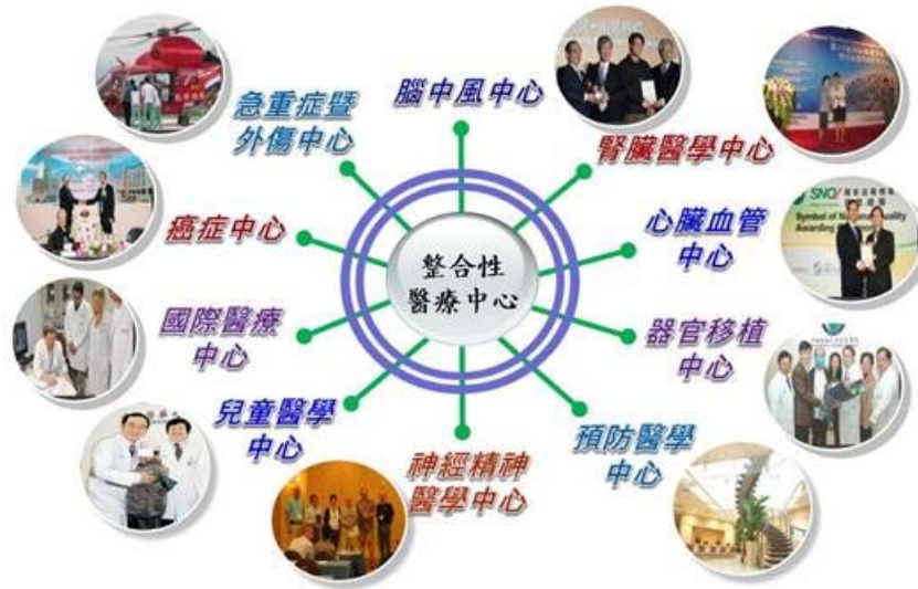
10 個整合性醫療中心提供高品質的服務