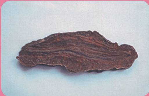
何首烏片橫斷面黃棕色至深褐色（引用台灣市售中藥材真偽及代用品圖集）