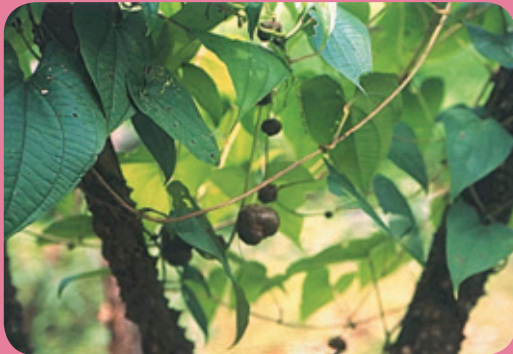
黃藥子為多年生纏繞草本（引用台灣市售中藥材真偽及代用品圖集）