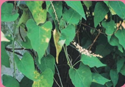
何首烏莖蔓藤狀，光滑。葉互生，先端漸尖（引用台灣市售中藥材真偽及代用品圖集）