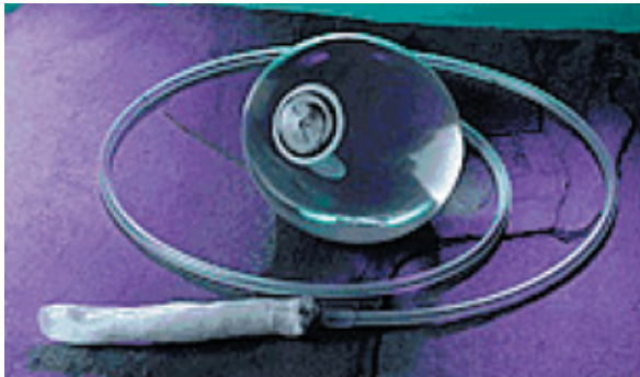
圖3：最多可在胃內待6個月的矽膠水球

水球放置在胃內，可以縮減胃容量、減慢食物進入十二指腸的速度，從而增加飲食後飽足感，達到因減少食量而減重的效果（圖4）。