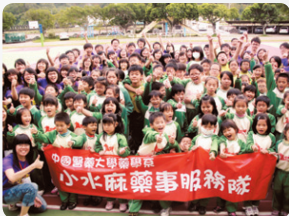
前往台中市馬鳴國小衛教宣導服務