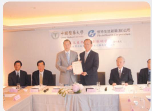
創辦產學連結創新研發室，與懷特生技新藥公司開發治療中風新藥。