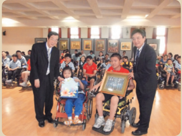
贈送「無線腦波監控輔具」，讓身心障礙學生也能享受瘋電玩的樂趣

教育」3大面向著手，整合電能需量監控管理系統、教室節能管控系統、改善老舊高耗能空調主機效率、汰換老舊照明設備、加裝與整合校園安全E化管理系統，以具體行動改善教學環境，朝綠色大學邁進。