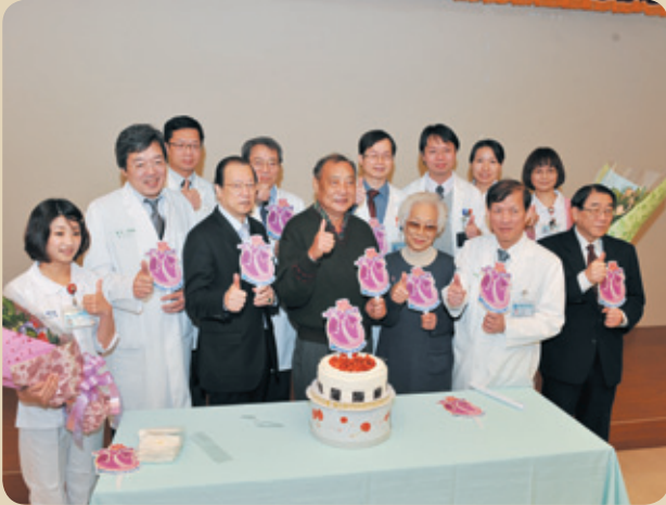
中國醫藥大學附設醫院完成首例心臟移植手術，醫護團隊為病患慶生