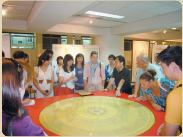
「立夫中醫藥展示館」是台灣唯一的中醫藥博物館，珍藏世界最大的羅經盤。

中國醫藥大學擁有國內首座「立夫中醫藥展示館」，典藏中醫藥的典籍文物及珍貴稀有藥用動物、礦物標本等，都是無價寶藏，並已實施數位化整理。此外，雖然學校位處台中市鬧區，仍設有寬廣的藝術中心，近年來推出高檔的百年人文傳承大展、音樂會、舞蹈、戲劇、博雅經典講座、社團展演及書畫展和校園藝術季活動，叫好叫座。