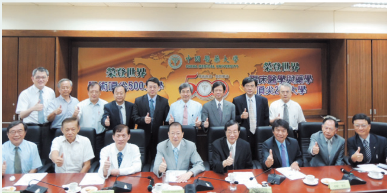
校院合一，眾志成城，中國醫藥大學榮耀的一刻！

備受稱道的犖犖大者有：醫學系獲醫學院評鑑委員會（TMAC）7年免評鑑；推動迷你臨床演練評量（Mini-CEX），榮獲2010年第6屆「國家人力創新獎」殊榮；連續6年獲得教育部「獎勵大學教學卓越計畫」，2011-2012年更榮獲全國第1名；國科會大專生研究計畫名列私立大學第1名；