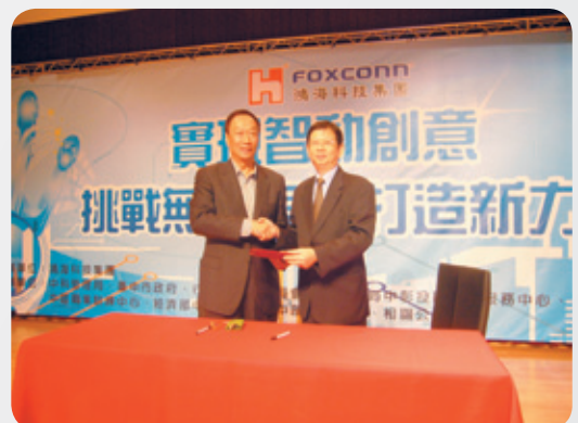
世界舞台的跳板，本校與鴻海科技集團簽約結盟。