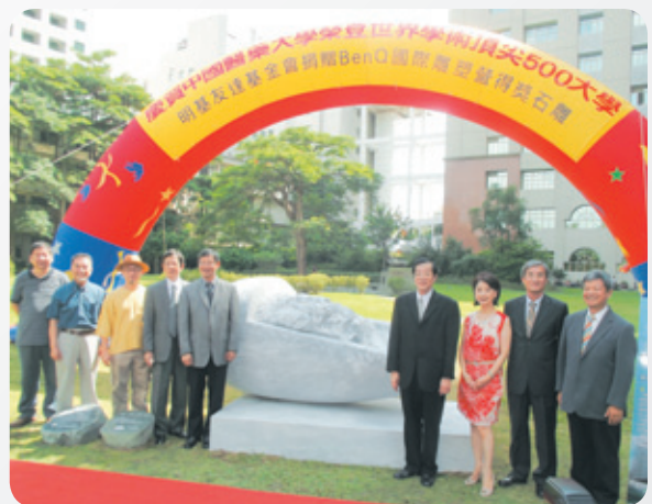
雙喜臨門，明基友達基金會贈送石雕慶賀。

會計室則積極推動電子化作業流程，從申請至核銷已經完全「雲端化」，整合縮減行政程序，有效減少資源浪費，提升效率與服務品質。在全校努力下，連續獲得教育部獎勵私立大學校院校務發展計畫中，醫學類組的高額獎助經費。🏆