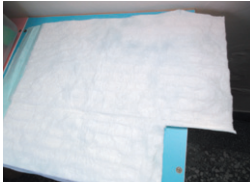
圖5：1塊產墊約可剪成12塊尿布墊