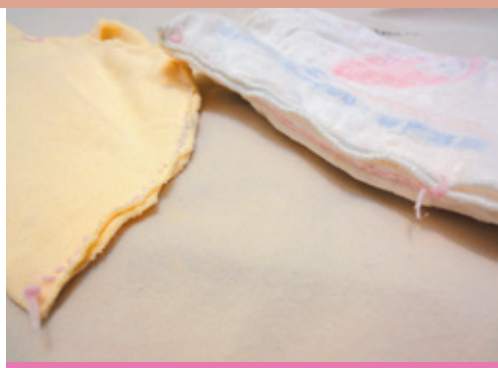
圖2：尿布墊縫線線頭藏在內側，避免摩擦寶寶屁股