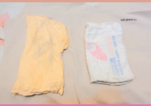
圖1：乾淨的純棉衣服或紗布巾都可以縫成尿布墊