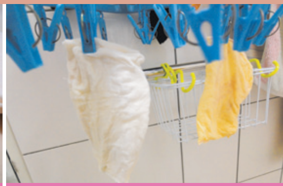
圖3：用過的尿布墊，洗淨晾乾，即可重複使用