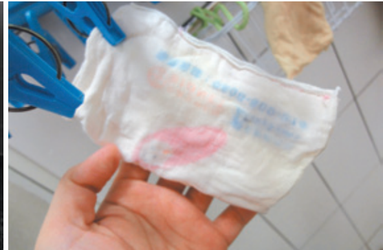
圖6：尿布墊大小約8×16公分

仔細觀察，小嬰兒每次大便的量通常不多，就是一點一點的，但若不換尿布，孩子又容易長尿布疹，怎麼辦呢？這裡有個好方法提供給大家：可用乾淨的純棉衣服或乾淨的小塊紗布巾，動手縫成長方形的尿布墊（圖1），厚度不宜太厚，寬度不可超過尿布的寬度，記得縫線打的結要藏在尿布墊內（圖2），避免縫線打結處直接摩擦到孩子的小屁股，造成不適。這麼一來，當孩子解了一點點大便的時候，換掉這塊尿布墊，加上洗屁股就可以了，通常不用整塊尿布都換掉。