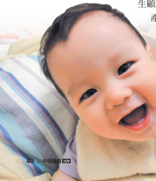
圖7：9個月大的母乳寶寶，頭好壯壯真可愛

哺餵母乳本來就很省奶粉錢，不但可以把小孩養的頭好壯壯（圖7，照片中的寶寶不過9個月大，體格可結實的呢！足足有10.5公斤重），還能減少使用奶粉及相關的瓶瓶罐罐（如：奶粉鐵罐）等用品，再加上利用手邊的材料來減少尿布的消耗，可真是環保的不得了。當個環保的母乳媽媽，妳也辦得到！👍