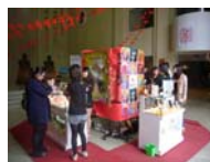
中國醫藥大學藥用化妝品系畢業成果展美豔登場。