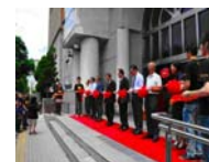
醫用化妝品學系畢業成果展揭幕。