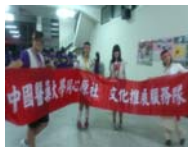
同心原社文化推廣服務隊