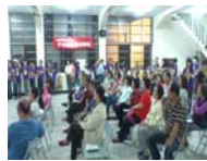
烏石坑社區民眾踴躍參與