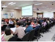
本校教師參與踴躍，對於面談學生相當重視