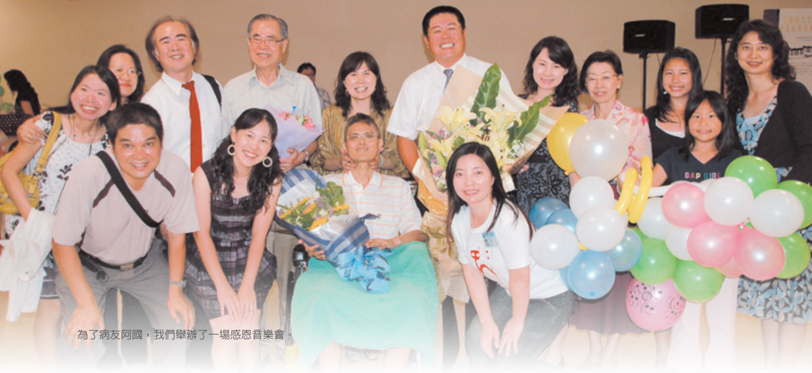
為了病友阿國，我們舉辦了一場感恩音樂會。