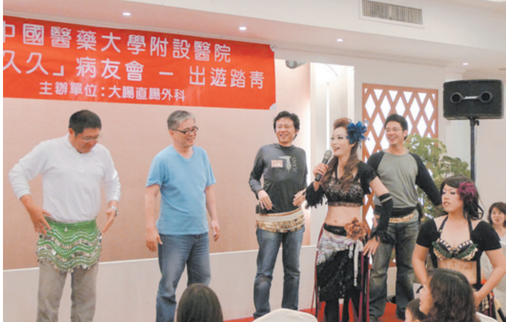
醫師與病友及家屬共舞，氣氛和樂。