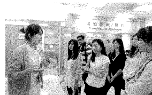
資深護理師導覽健檢及「輝耀門診」就診流程

尤其是3樓檢查區，屬於高階健康檢查的電腦斷層掃描儀CT、磁振造影MRI、正子造影PET等「重裝備」，都是專屬健檢中心使用。中國醫藥大學附設醫願意不計成本提供民眾最好的健檢服務，只能說臺中的民眾太幸福了。☺