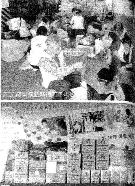
志工夥伴協助整理二手物資