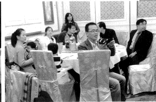
年輕校友參與母校訪問團餐會