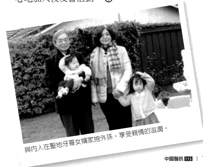
與內人在聖地牙哥女婿家抱外孫，享受親情的滋潤。

美國校友看到母校師生頻頻來訪，更能凝聚向心力，校友會也募集基金，補助經濟弱勢學生相關費用，並且就近招待及照顧。據我觀察，美國校友也有年輕化的趨勢，最近幾年去美國留學就業的年輕校友都會很熱心地加入校友會活動。