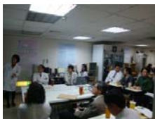
三位學生參與附設醫院臨床用藥評估團對會議