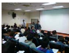
三位學生參與藥三實證藥學課程