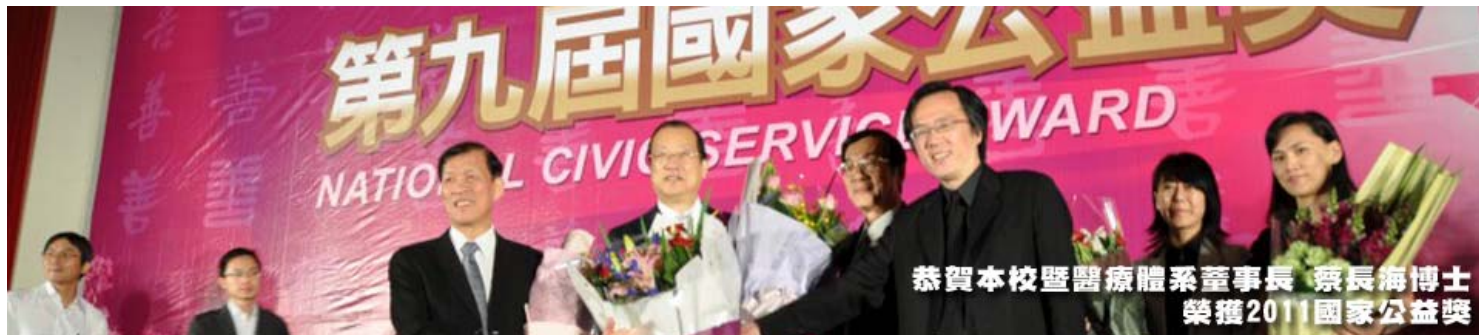
恭賀本校暨醫療體系董事長 蔡長海博士 榮獲2011國家公益獎