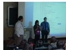
三位學生參與藥三實證藥學課程