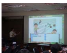
IRS 學生答題即時統計