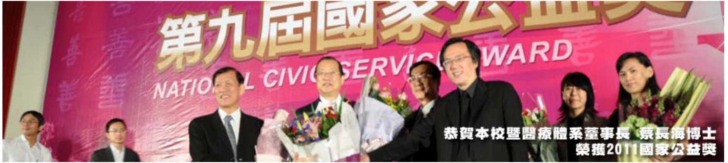
恭賀本校暨醫療體系董事長 蔡長海博士 榮獲2011國家公益獎