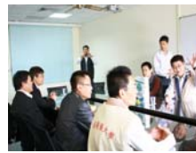
服務學習學務參訪（台東大學）