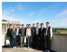
於台東大學行政大樓合影