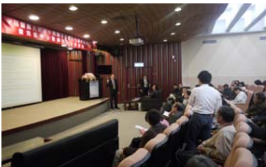
整場活動辦隨著最後一題 Q&A 而落幕，看到大家收穫豐盛、滿載而歸，這些辛苦都是值得的，感謝大家的參與！