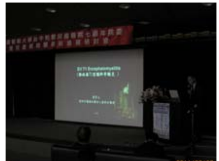
因臨時調整順序，所以第五位講者改為童綜合醫院的遲景上副院長，主講腸病毒 71 型，主持人由中國附醫兒童醫院彭慶添院長擔任。