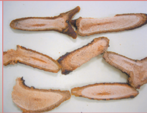
桑寄生對於治療冠心病、心絞痛患者有不錯的效果