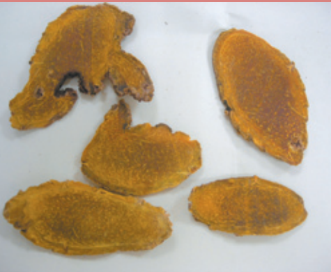
薑黃能降低血清膽固醇與抑制脂肪酸合成