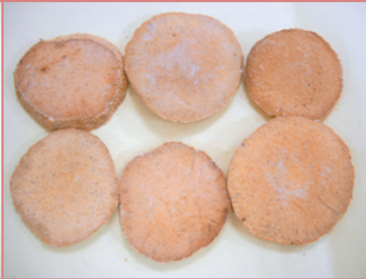
澤瀉能降膽固醇與降血脂