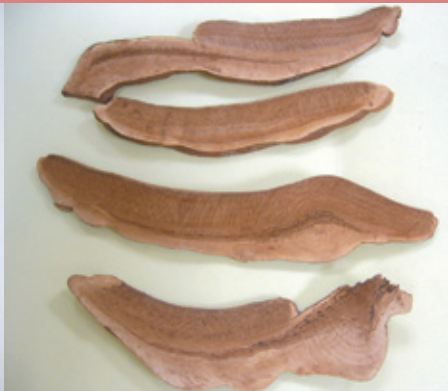
靈芝能降血脂、抗缺氧與增加冠動脈血流量