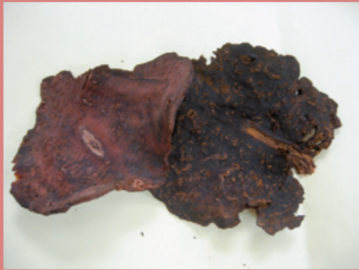
何首烏能降血脂及延緩動脈粥狀硬化