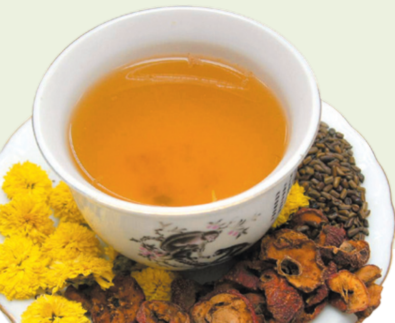
以山楂、決明子與菊花煮成的中藥茶飲