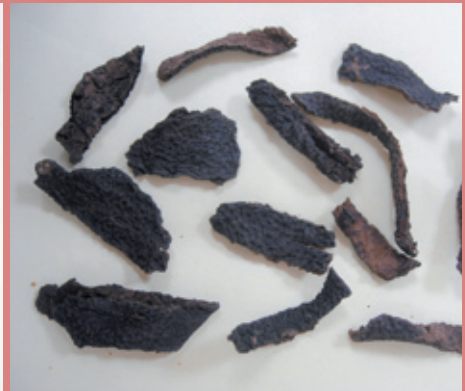
陳皮有助於改善動脈粥狀硬化

步、羽球、游泳、舞蹈、體操等，循序漸進。規律運動能增加心肺功能，促進血液循環，防止動脈硬化。