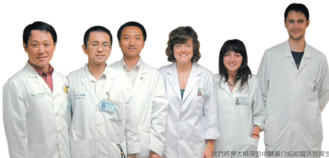
我們將博大精深的中醫藥介紹給國外見習生

所謂高血脂是指血中的脂類含量超過正常範圍，這些脂類主要成分包括膽固醇、三酸甘油脂、磷脂質與游離脂肪酸等。除了使用西藥以外，不少中藥也有降低膽固醇和三酸甘油脂，改善高血脂的效果。以下介紹其中幾味常用藥：