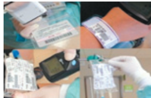
護理師刷員工證、病人手圈及完成給藥後資料上傳確認存檔藥品條碼，確認給藥。