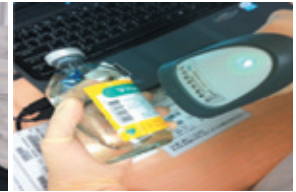
刷藥品條碼確認備藥