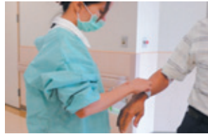
護理師替病人套上手圈