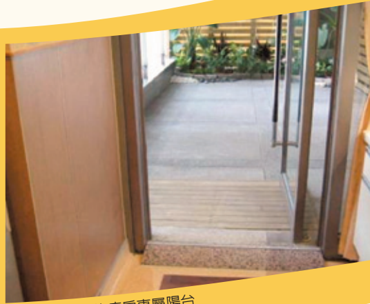
可到戶外散心的病房專屬陽台