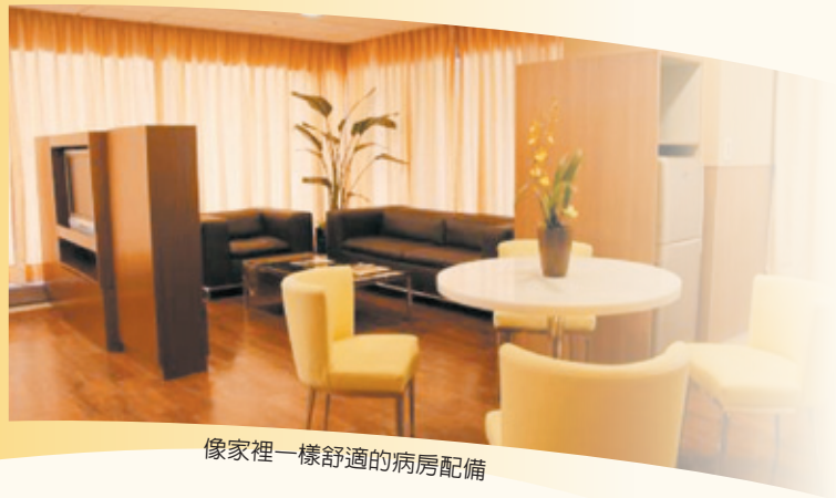
像家裡一樣舒適的病房配備