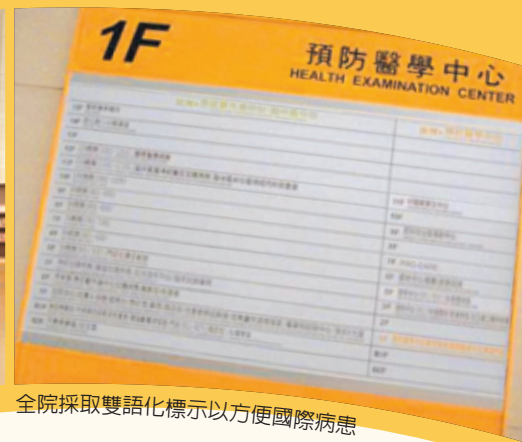
全院採取雙語化標示以方便國際病患