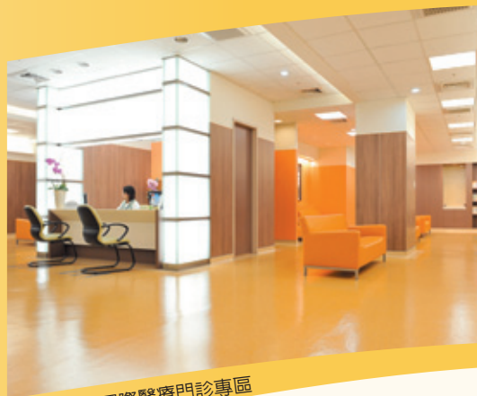
具隱密性的國際醫療門診專區