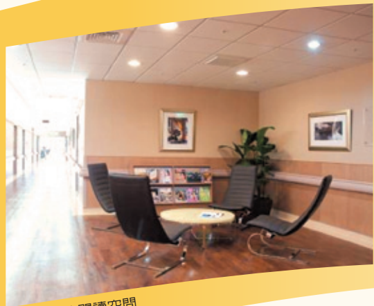
寬敞寧靜的閱讀空間