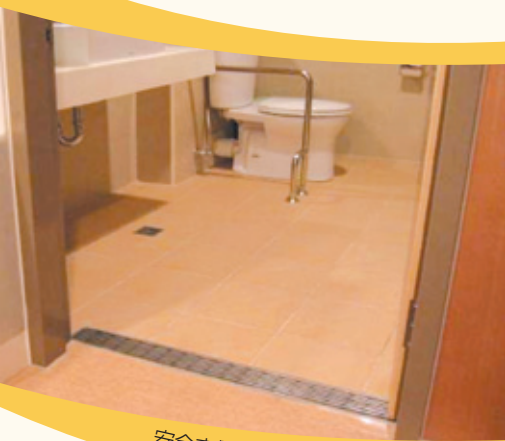
安全方便的無障礙空間