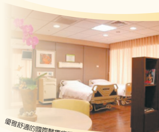
優雅舒適的國際醫療病房

近幾年來，亞洲發展國際醫療服務（觀光醫療）聞名於世者，包括泰國、印度、新加坡、馬來西亞、菲律賓等國，深獲歐美人士青睞。各國均有其發展目標，泰國希望成為亞洲「健康照護的產品和服務中心」；新加坡成立健康照護工作小組，期能成為「亞洲的醫療樞紐」；馬來西亞政府和民間企業合作，期能成為「亞洲的健康觀光樞紐」。台灣具有醫療上的強力優勢，本已不斷與海外醫療機構合作，自從包括本院在內的多家醫院陸續通過JCI國際醫療認證，