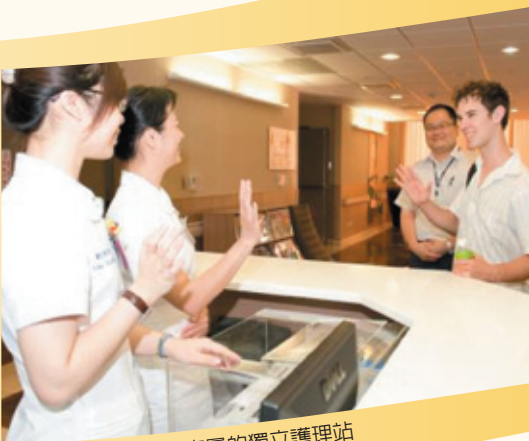
專屬的獨立護理站

在異業結盟合作方面，國際醫療中心與多家旅行社、教育事業單位簽署合約，並且配合政府政策，透過與外貿協會、行政院衛生署國際醫療管理工作小組的合作，共同執行各項推廣政策。