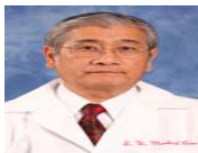
簡化分子生物學的良師--李昭鉉教授