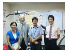
參訪運醫系教學設備