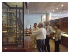
參訪台中市著名的科博館