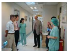
參訪本校附設醫院牙科部