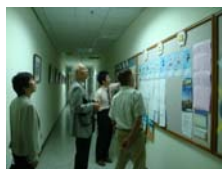
參訪本校牙醫系與口衛系教學設備