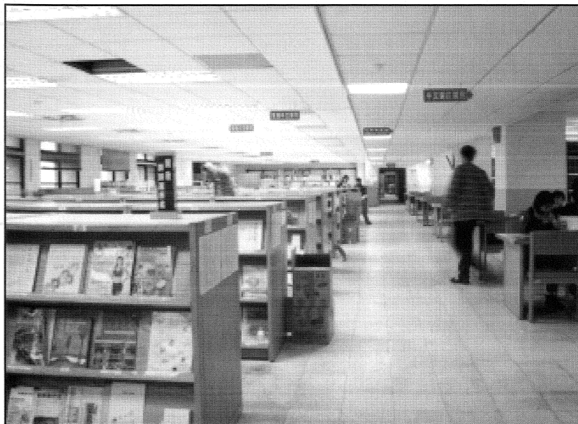
平時多多翻閱期刊論文，充實自我，養成主動求知的好習慣。