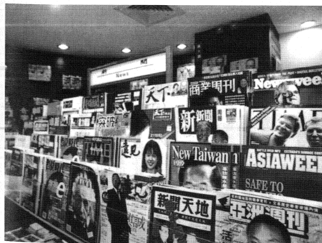
善用手邊的資訊，就可以在繁忙的醫學課業下找到另一片天空。