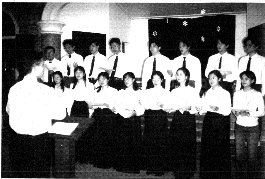
社團提供你一個發光發熱的舞台。

年屆成年，身爲大學生的我們，其實也該爲進入社會作些準備，開闊眼界，瞭解社會時情，並培養一些基本能力，才不致自封於象牙塔裡的溫室中，造成將來投入