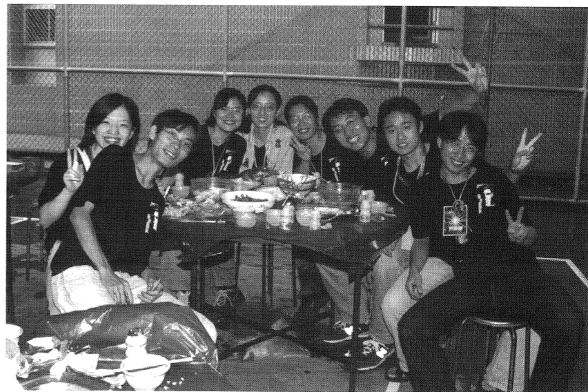
不被學校支持的社團活動，就只能靠學生的熱情來支撐。

醫學系的課業繁重，許多人十分依賴共筆，而且不論你讀不讀原文書，考前都一定得唸唸共筆，掌握考訊，於是眾人對共筆的品質就有相當程度的要求，這使得共筆組員戰戰兢兢不敢懈怠，這在本校形成一種特殊的文化，能不能高分過關，共筆的精良與否倒成了關鍵。儘管學長姐們一再告誡，念共筆得不到完整的觀念，對我們沒有幫助，只有唸原文書，不但能增進英文閱讀能力，而且也較易獲得有系統的整體概念，可是，當面對數