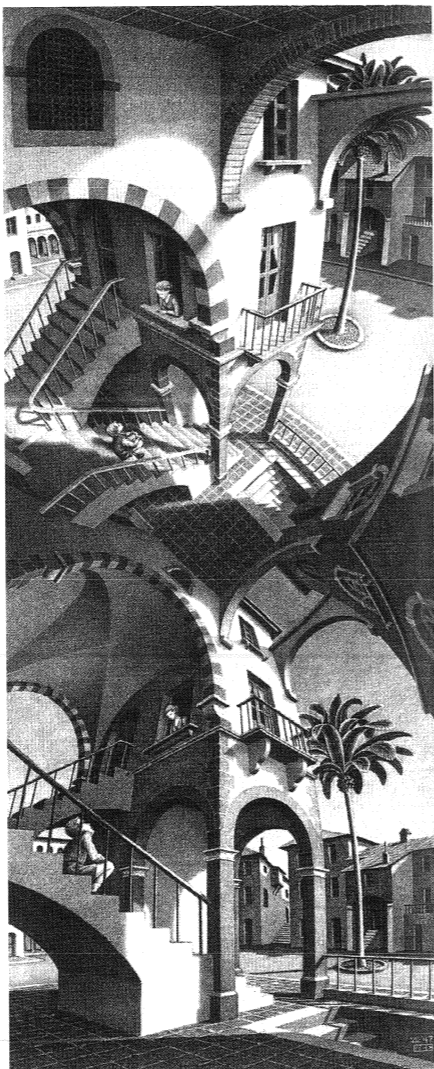
換個角度看世界，或許中國不是那麼一無可取。

雖然有少數學長姐展現了和其他醫學院生一樣驚人的毅力和積極，「但是很少。」學長面有難色，「不過如果要改的話，得從教學制度著手。」我們學校的教學方法，仍是填鴨式的教育，老師給什麼就吸收什麼，而老師不教的部分，理所當然地不用會。這樣的教學制度，讓中國的學生在怠惰中失去鬥志。台大、陽明等醫學院的教學方法，已經逐漸改進，他們學習美國的教學方法，給了學生主動學習的機會和訓練。我們要徹底解決這樣的問題，也許應以他們為借