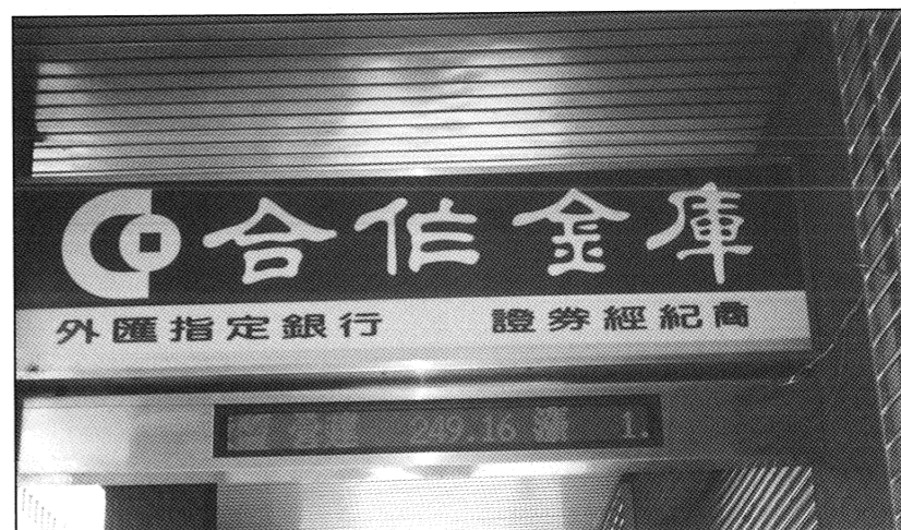
提款機的設置為同學們帶來極大的便利

3000到5000元，佔六成強，5000到7000元約有兩成，3000元以下者有一成半，高低之間每月就差了將近4000元。其他項目如水、電、電話費等基本開支；開學後的家費、朋友慶生、和好朋友心血來潮去吃大餐等，或是自己本身的嗜好、樂器、雜誌、電腦升級或是補習等，皆是消費大宗；而有男女朋友的人可能還要支出更多的電話費，同時約會請客，出門玩的機率又大增……。