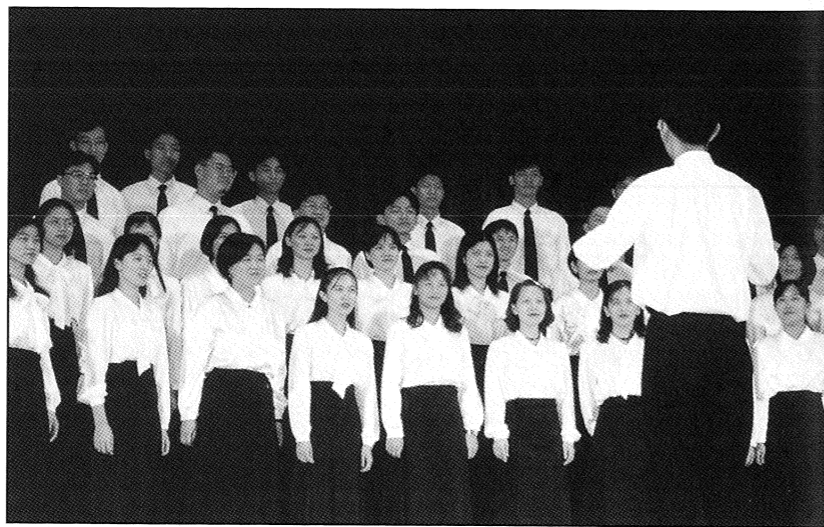
多采多姿的社團活動滿足了每一顆年輕想飛的心

「其實只要順其自然就好，因為忙久了就會習慣這種生活，自己就會產生一套利用時間的方