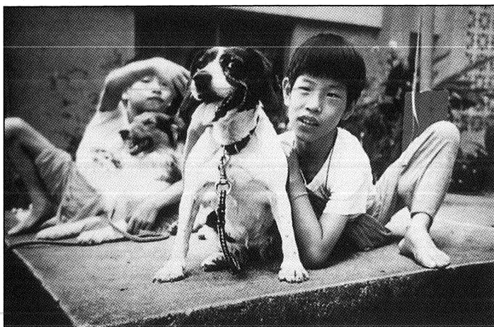
頑皮是每個小孩的天性，即使忠義大哥也不例外